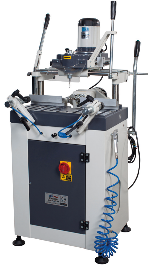
GALAXY - II