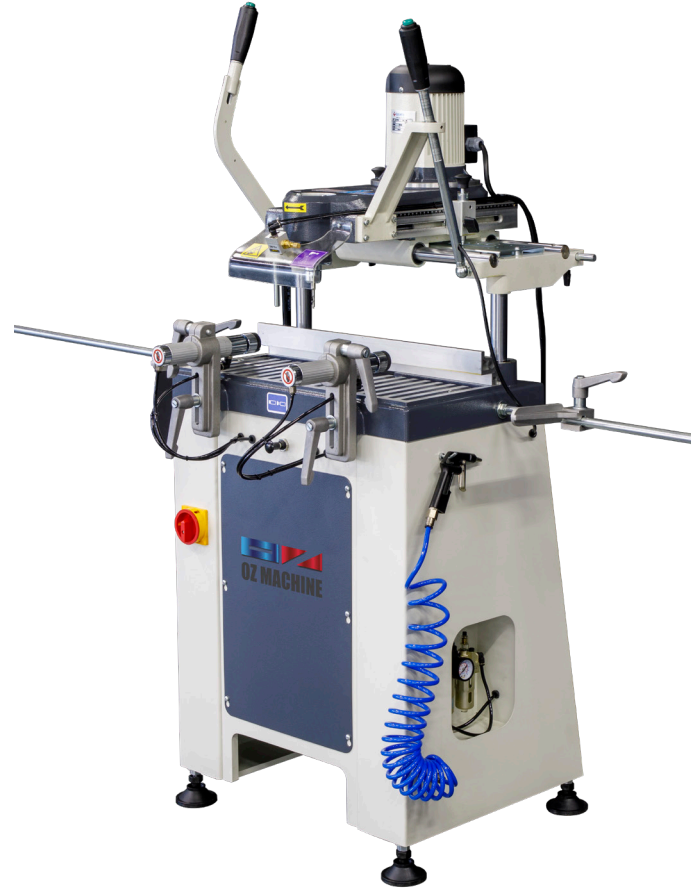
GALAXY - I

GALAXY SERIES / SÉRIE GALAXY / СЕРИЯ GALAXY / LA SERIE GALAXY / GALAXY سلسلة